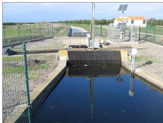
Fig. 13 – Canal principal: nó do Xacafre