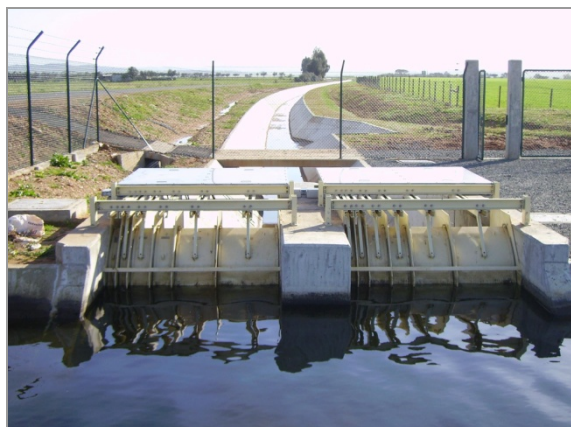
Fig. 12 – Canal principal: módulos de rega automatizados