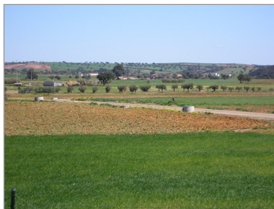
Fig. 15 – Bloco 1: rede de rega sob pressão