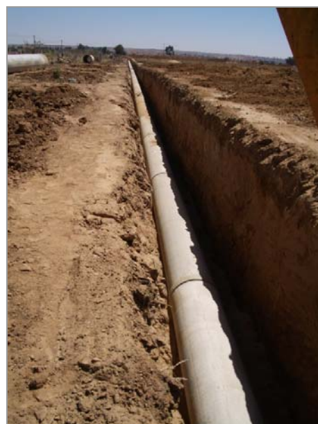
Fig. 9 – Modernização do Bloco 1