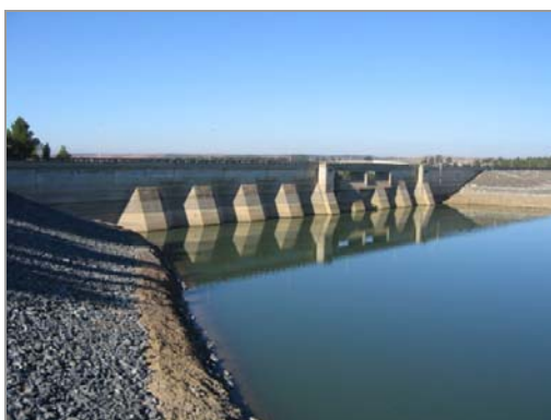
Fig. 2 – Barragem (paramento de montante)

O regadio baseia-se na utilização do potencial hídrico criado pela construção da barragem na ribeira do Roxo: 96,3 hm 3 .