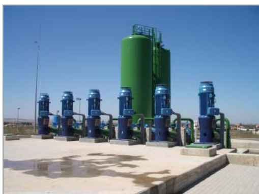
Fig. 4 – Estação de bombagem