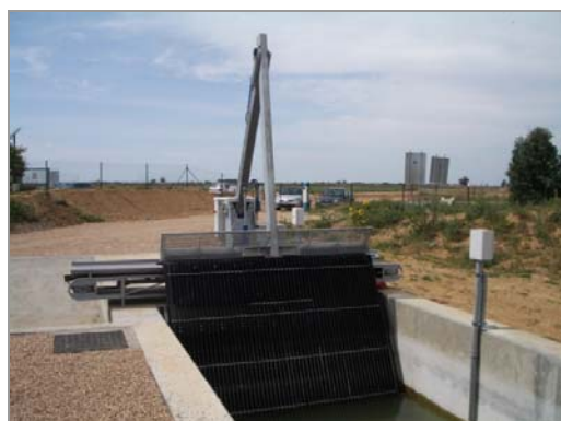
Fig. 11 – Limpa-grelhas