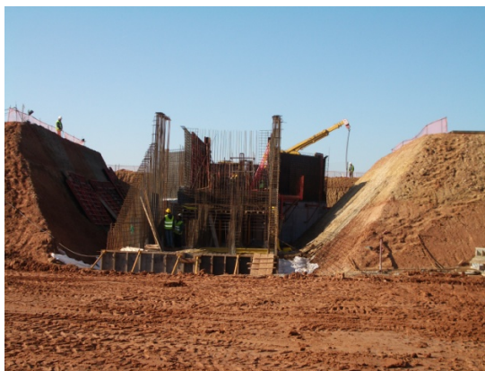
Fig. 6 – Reservatório do Bloco 1 (construção)