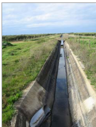
Fig. 14 – Distribuidor de Monte Novo