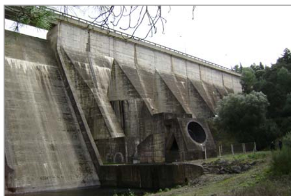
Fig. 3 – Descarregador de cheias