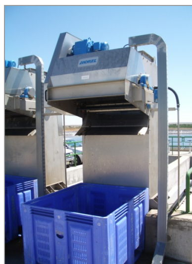
Fig. 5 - Equipamento de filtração