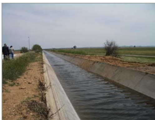
Fig. 10 – Canal Principal