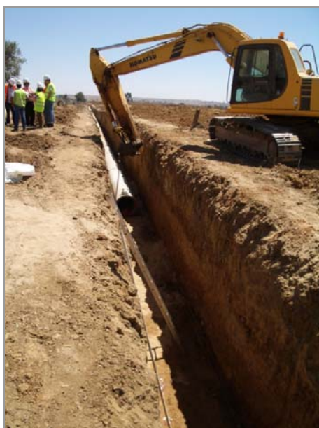
Fig. 8 – Modernização do Bloco 1