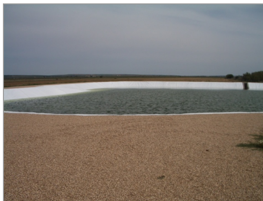
Fig. 7 – Reservatório do Bloco 1