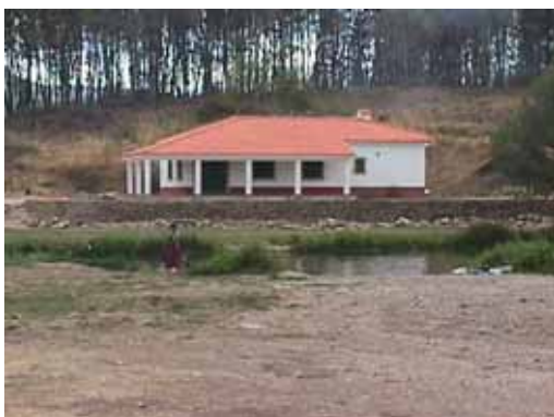
Zona de Lazer da Benquerença