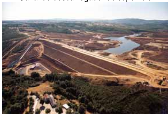
Vista aérea durante a fase de construção