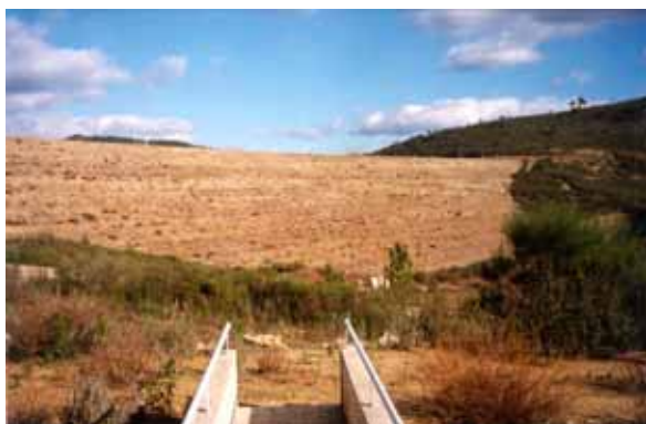
Paramento de jusante