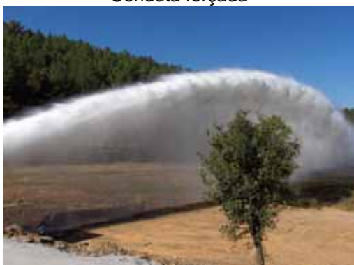
Descarga da conduta forçada