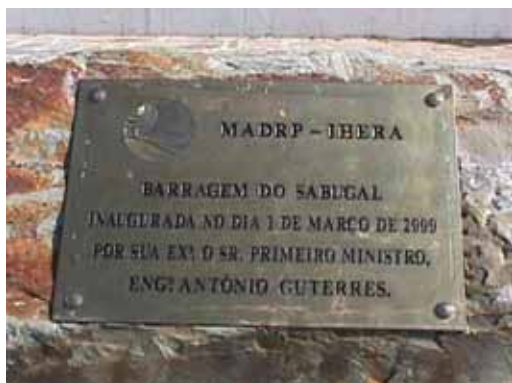
Placa de inauguração