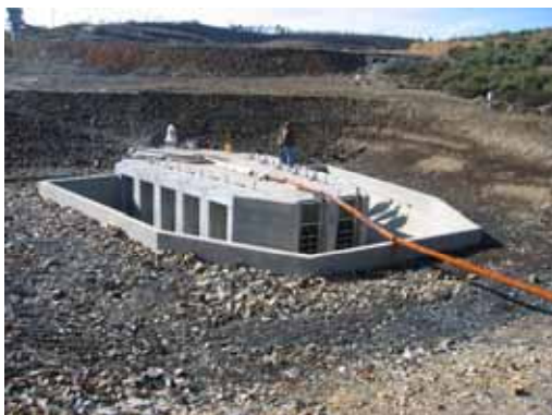
Estrutura ambiental da tomada de água