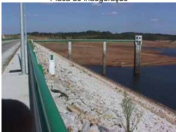
Tomada de água