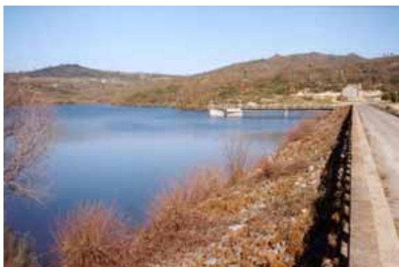
Paramento de montante