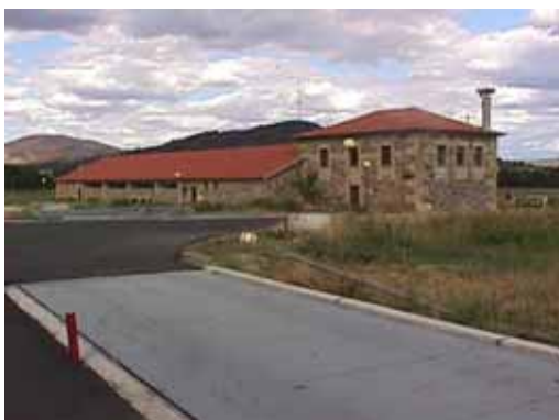
Quinta do Anascer