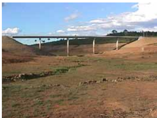
Ponte da Malcata