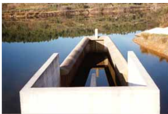
Descarregador de superfície