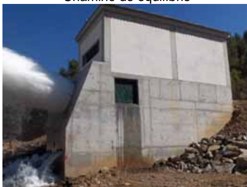
Casa das válvulas de jusante