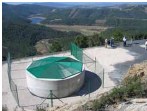
Chaminé de equilíbrio