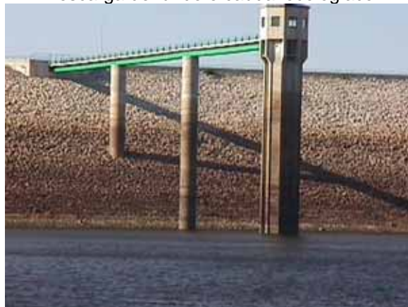
Torre da tomada de água