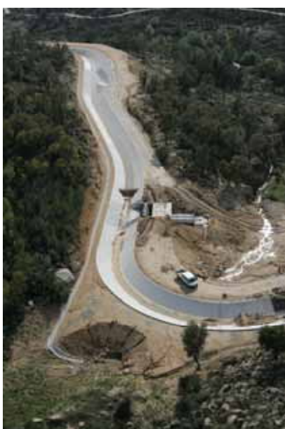
Canal condutor geral – troço km 13+312 a 29+007