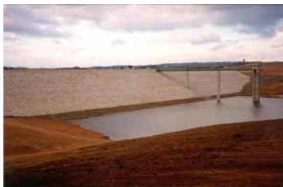
Paramento de montante