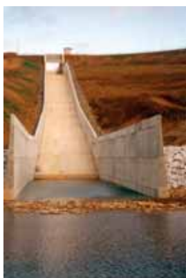
Canal do descarregador de superfície