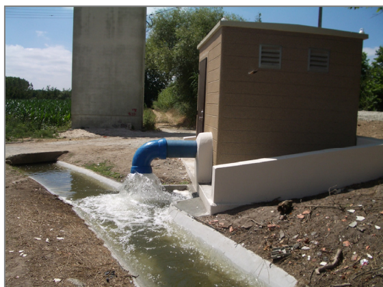
Fig. 6 – Estação de bombagem do Plátano