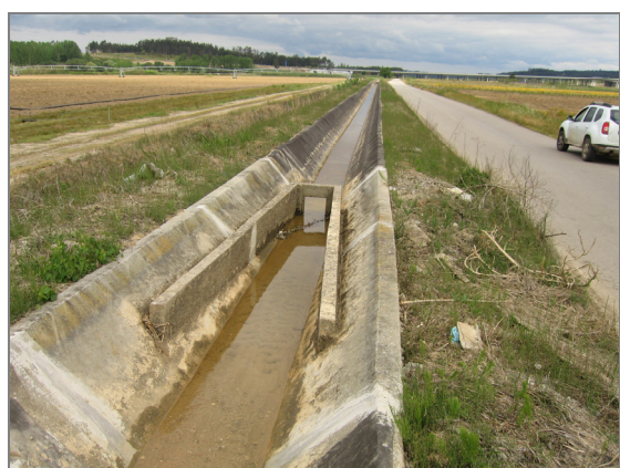
Fig. 8 – Canal II (Barreiros)