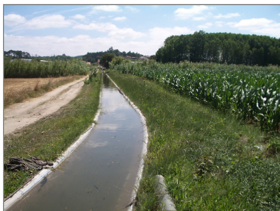
Fig. 7 – Canal secção a montante do Plátano