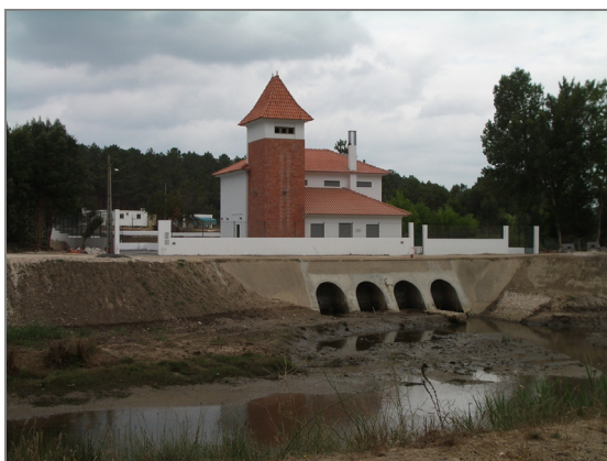
Fig. 15 – Antiga estação de bombagem da Bajanca