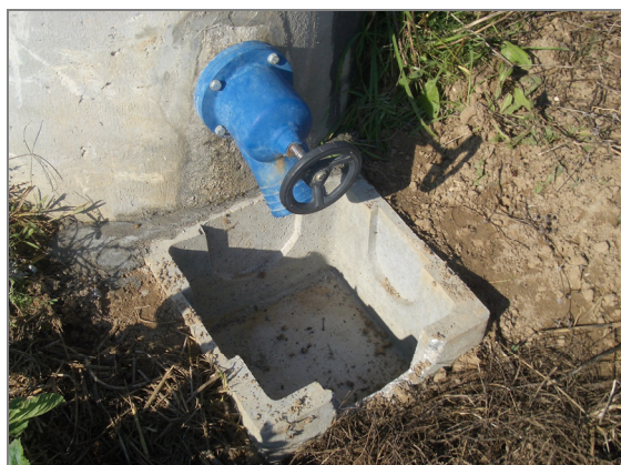
Fig. 14 – Boca de Rega