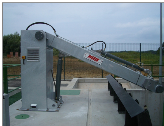
Fig. 5 - Limpa-Grelhas