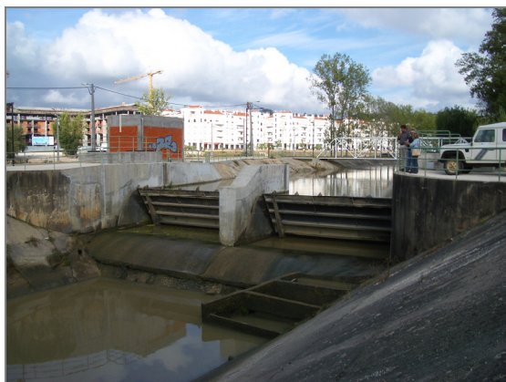
Fig. 2 – Açude do Arrabalde (Leiria)

O regadio baseia-se na utilização do potencial hídrico das diferentes linhas de água que atravessam o Vale.