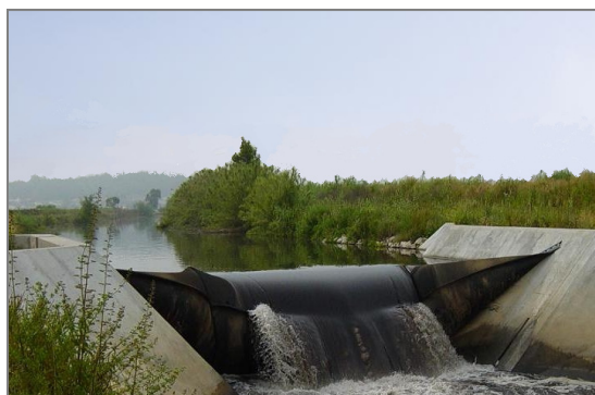
Fig 3 – Açude insuflável das Salgada