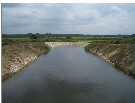
Fig. 11 – Vala de ligação do rio Negro à estação do Miguel