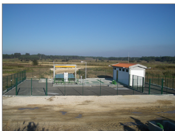
Fig. 10 – Estação de bombagem do Miguel