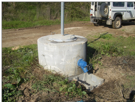
Fig. 13 – Caixa de Rega