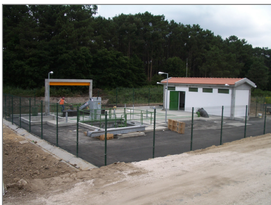
Fig. 4 – Estação de bombagem do Boco