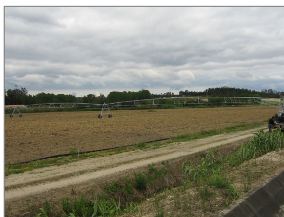
Fig. 9 – Rampa pivotante frontal