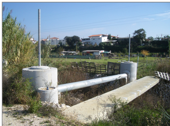
Fig. 12 – Regadeira 19 (Canal I)